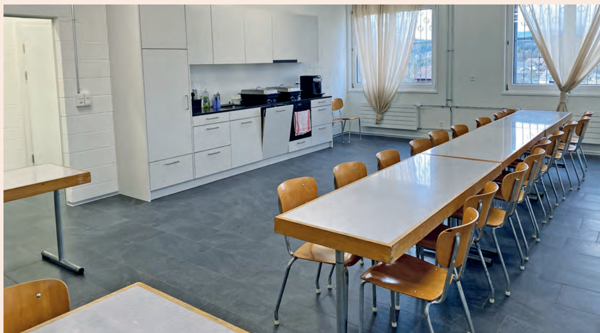
Mittagstisch der Sek I in Schnottwil

Auch in Schnottwil startete im Frühling 2024 ein neues Betreuungsteam. Ausserdem werden die Jugendlichen ab Sommer im neuerstellten Mehrzweckraum des Feuerwehrmagazins begrüsst. Ein grosses Dankeschön an die Gemeinde Schnottwil, die den Mittagstisch beim Umbau des Feuerwehrmagazins eingeplant hat und so die Nutzung durch die schuKiBe ermöglicht!