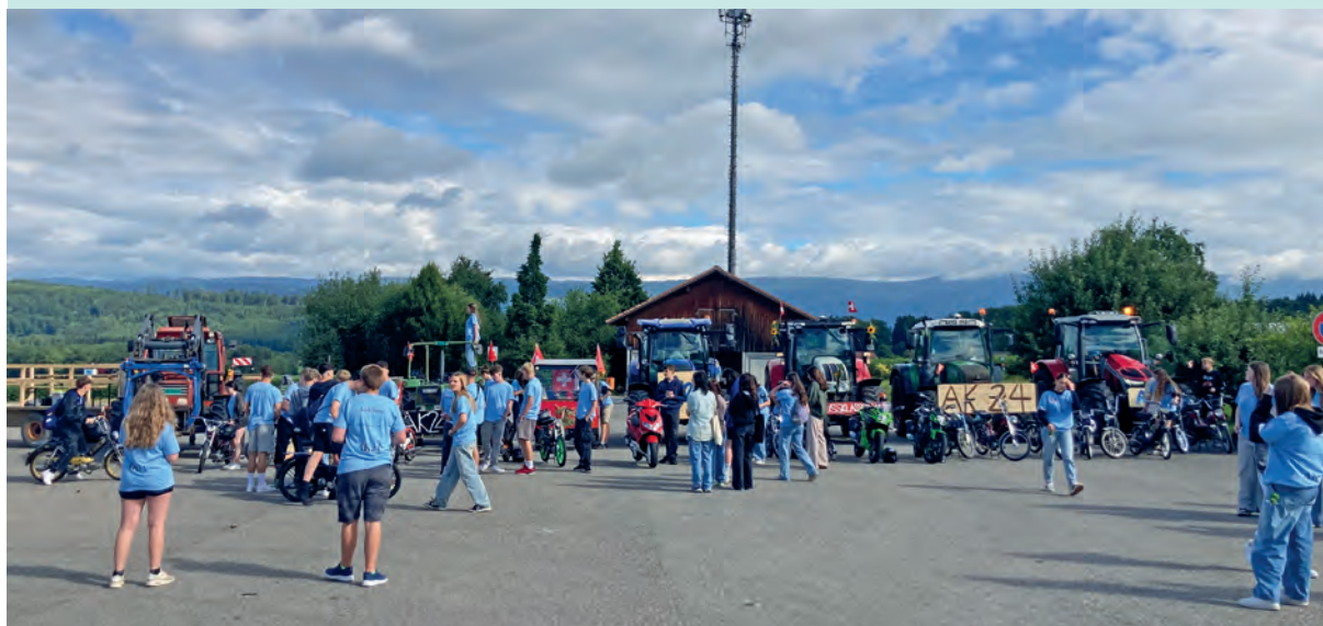
Stimmung anlässlich der Schulschlussfeier der Sek I