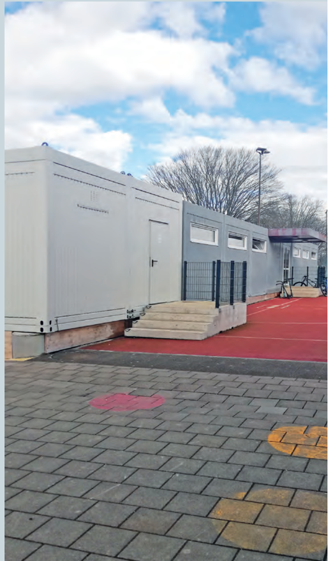
Pavillons in Messen – die Übergangslösung

In Lüterkofen wurden diverse Reparaturen und Ersatzbeschaffungen für den Spielplatz getätigt und ein Transportanhänger angeschafft. Die jährlichen Storen-Reparaturen mit den Ersatzbändern wurden umgesetzt.