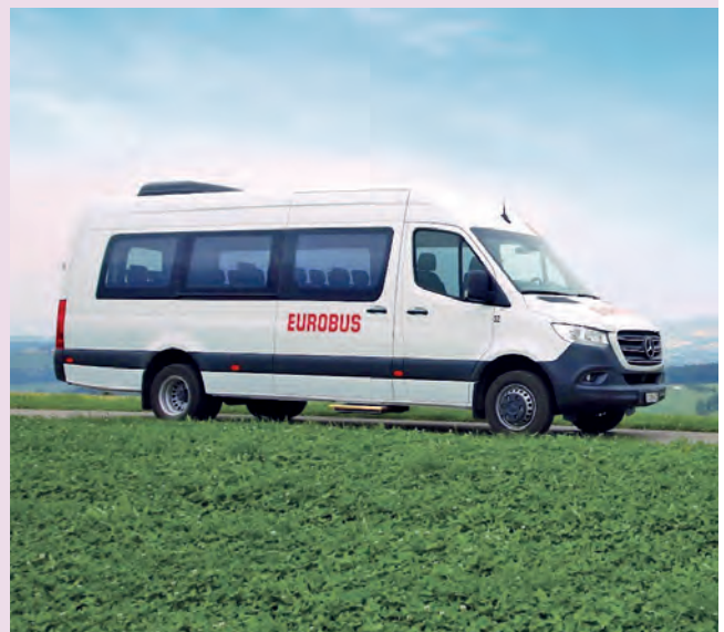
Ein Fahrzeug der Kindergartentransporte

Die Routen und Haltestellen der Schulbusse wurden vom öffentlichen Verkehr übernommen, was den Vorteil hat, dass sich die Kinder schon im Kindergartenalter an die Struktur des öffentlichen Verkehrs gewöhnen können. Die gesetzlichen Grundlagen der Schulbusse unterscheiden sich teilweise von denen des öffentlichen Verkehrs. Insbesondere müssen alle Kinder im Schulbus zwingend einen Sitzplatz haben und während der Fahrt angeschnallt sein. Für den Alltag heisst das, dass die Kinder, anders als im öV, nicht mehr einfach so eine andere Linie fahren können. Zu Beginn eine grosse Umstellung für die Eltern, die gewöhnt daran waren, ihre Kinder am Mittag zum Grosi, welche in einem anderen Dorf wohnte, zu schicken. Für uns bedeutet dies einen erhöhten organisatorischen Mehraufwand.