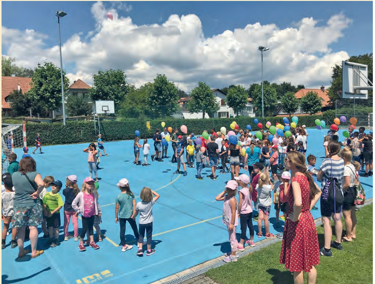
Spielmorgen an der Primarstufe Lüterkofen