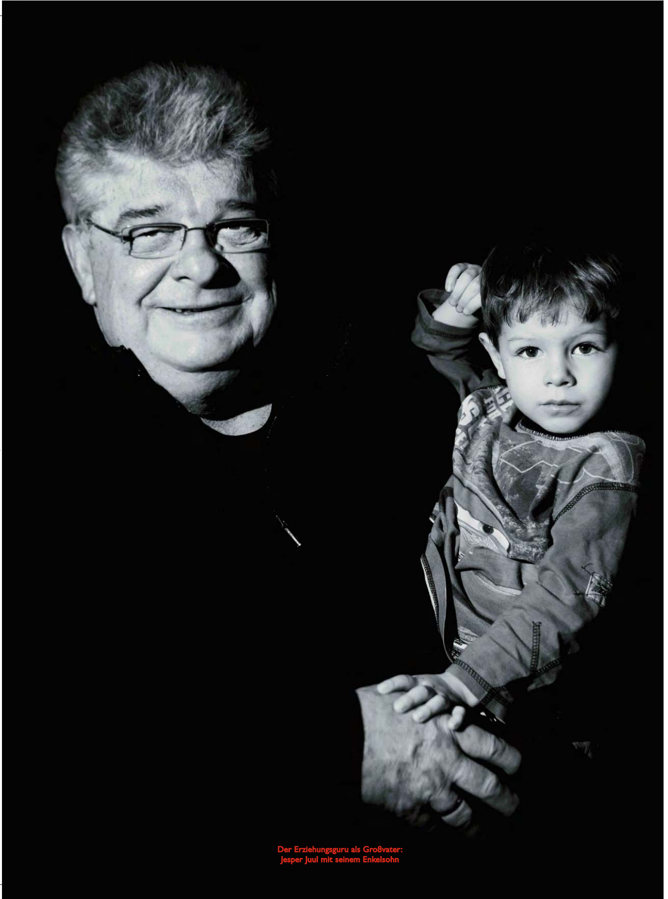
Der Erziehungsguru als Großvater: Jesper Juul mit seinem Enkelsohn